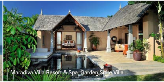
Maradiva Villa Resort &amp; Spa, Garden Suite Villa