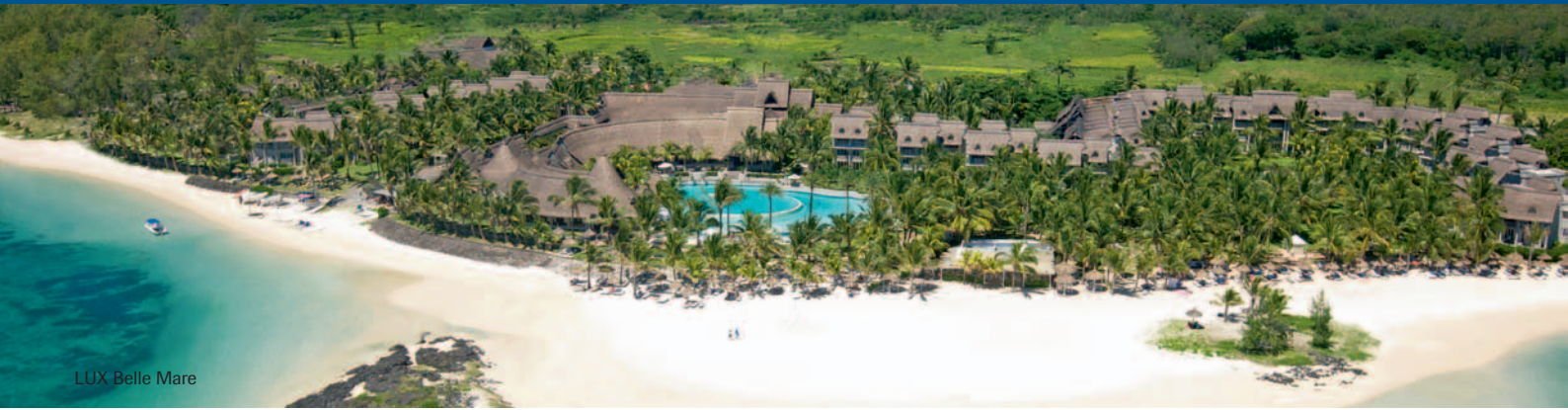
LUX Belle Mare