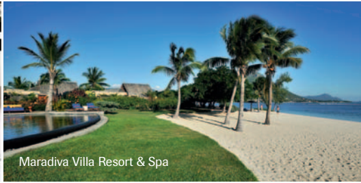
Maradiva Villa Resort &amp; Spa